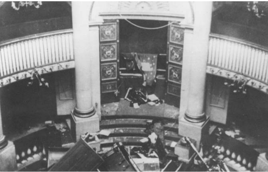
Zerstörungen im Stadttempel