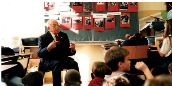
Leon Zelman (1928–2007) im Dialog mit Alt und Jung

Service unter anderem auch bei der Kontaktaufnahme zu Behörden und jüdischen Organisationen sowie bei der Spurensuche nach der eigenen Familiengeschichte.