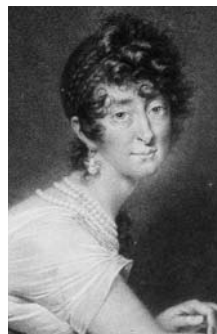
Fanny von Arnstein

Das Revolutionsjahr 1848 ist ein bedeutendes und veränderndes Jahr für die Wiener