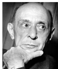
Arnold Schönberg: Begründer der Zwölfton- musik

Arnold Schönbergs Nachlass verblieb nach seinem Tode im Jahre 1951 im Besitz seiner Familie. 1977 wurde die Sammlung dem Arnold Schoenberg Institute an der University of Southern California in Los Angeles zur Verfügung gestellt. 1997 wurde die Arnold Schönberg Center Privatstiftung von der Gemeinde Wien und der Internationalen Schönberg Gesellschaft gegründet. Im März 1998 wurde das Schönberg Center im Palais Fanto eröffnet und steht als Archiv für wissenschaftliche Schönberg-Studien und Forschungen zur Verfügung.