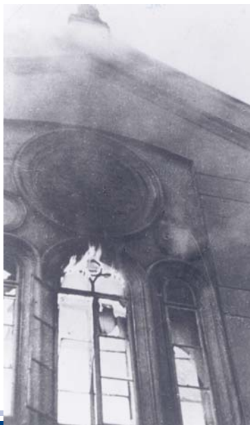
Brennender Tempel in der Großen Schiffgasse

Im Novemberpogrom in der Nacht vom 9. auf den 10. November 1938 brennen Synagogen und Bethäuser, jüdische Geschäfte werden geplündert und zerstört. Die von Adolf Hitler angeordnete „spontane Entladung des Volkszornes“ greift voll durch. Mit Ausnahme des Stadttempels in der Seitenstettengasse werden sämtliche jüdische Gotteshäuser