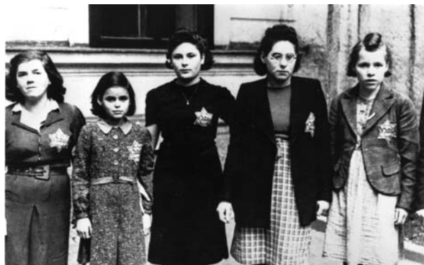
Wiener Jüdinnen mit aufgeheftetem Judenstern

Wienerinnen und Wiener haben einfach weggeschaut. Hitlers Rassenwahn gipfelt erstmals in den Nürnberger Gesetzen, die der jüdischen Bevölkerung so gut wie alles verbieten und nehmen. Sie hat den gelben Stern zu tragen und die Vornamen „Sara“ bzw. „Israel“ anzunehmen. Viele Geschäfte werden enteignet („Arisierung“)