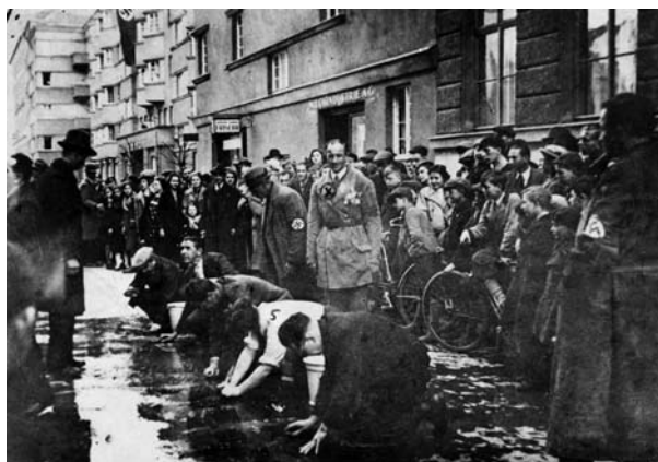
Jüdinnen und Juden werden unter dem Beifall zahlreicher Umstehender gezwungen, die Straße zu waschen