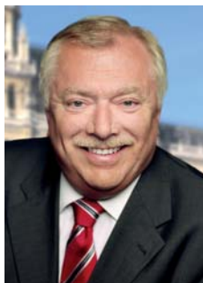
Dr. Michael Häupl, Bürgermeister